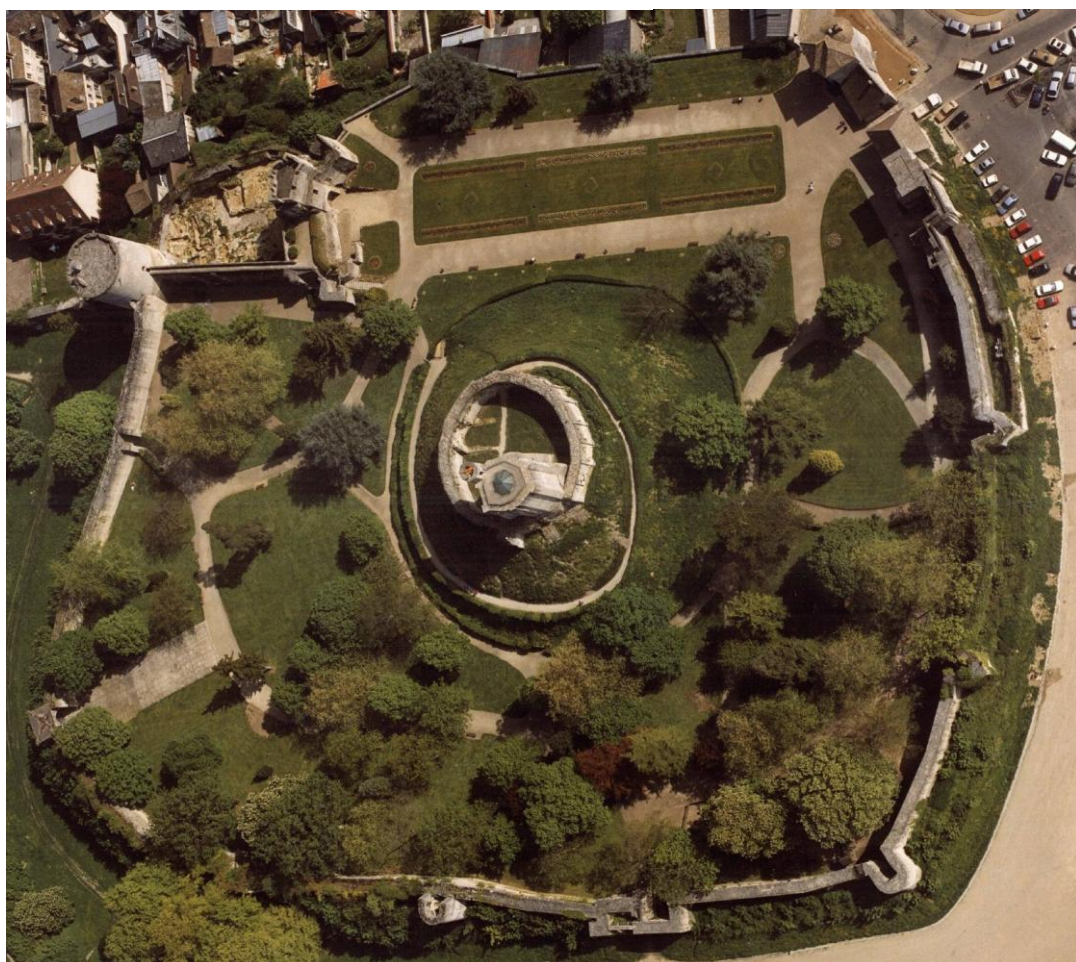
Photo aérienne du château avec, en haut à gauche, la Barbacane