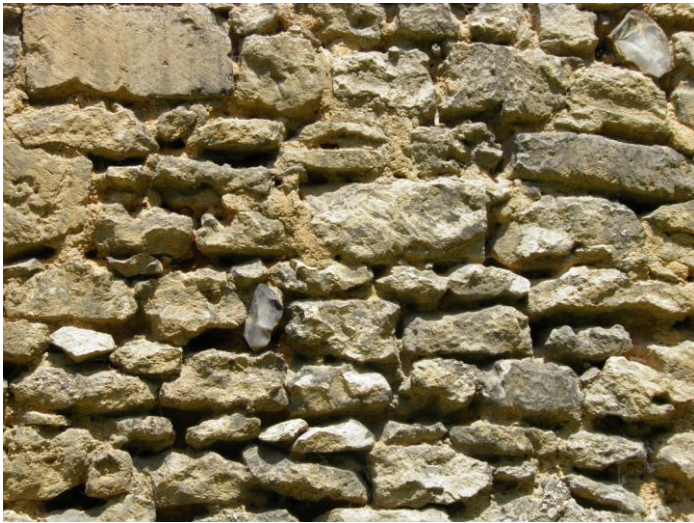
Parement en moellons équarris (calcaire et rares éléments en silex).

Au château de Gisors, le parement des remparts est généralement constitué de moellons équarris et plus rarement de pierres de taille.