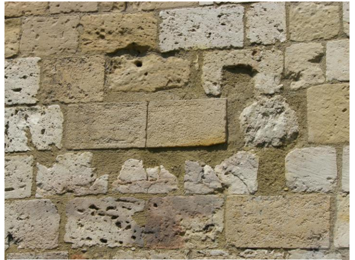
Parement en pierres de taille assisées.