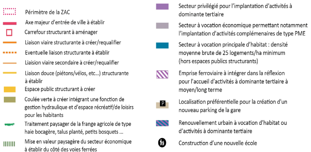
Plan d'aménagement retenu